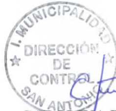
CAROLINA PAVEZ CORNEJO DIRECTORA DE CONTROL